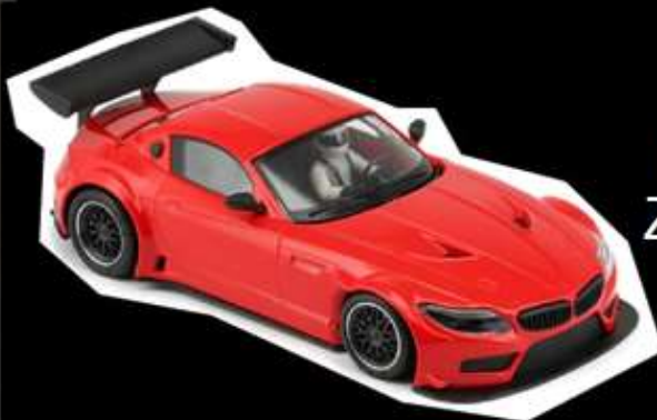
BMW Z4 GT3