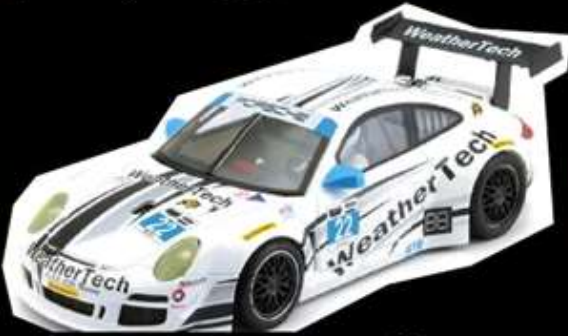
Porsche 997 GT3