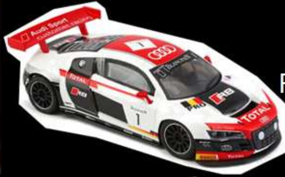
Audi R8 GT3