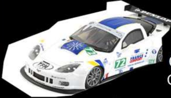
Corvette C6R GT2